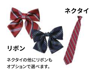
ネクタイ リボン ネクタイの他にリボンも オプションで選べます。