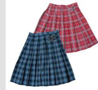
スカート (夏用・冬用)

理知的で誠実なイメージの濃紺のジャ ケットにアクティブなエンジのバイピング。 軽くてストレッチ性・耐久性にも優れ、 抗菌・消臭機能も万全です。