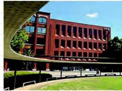
京都府・滋賀県 龍谷大学

400年の歴史ある総合大学 伝統に甘んじず、自己を 省みる精神で革新的な大 学創造を推進