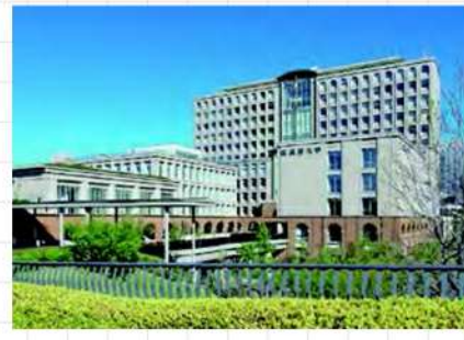
東京都 武蔵野大学

夢の実現を力強く後押し する大学。学部横断型の 教養教育で「共に支え合い 創造し未来を切り拓く力」 を養成