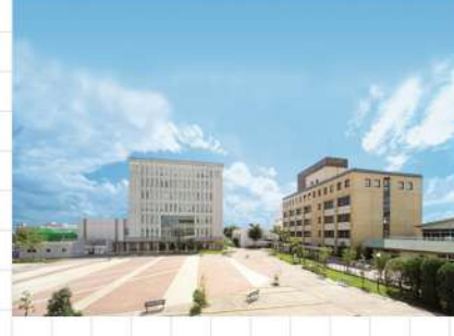
岐阜県 岐阜聖徳学園大学

愛の精神で人を育む大学 音楽学部をはじめ、各学 部での専門人材の育成に 高い評価