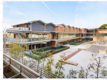
京都府 京都女子大学

400年の歴史ある総合大学 伝統に甘んじず、自己を 省みる精神で革新的な大 学創造を推進