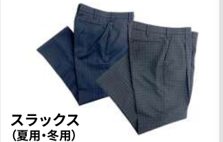
スラックス (夏用・冬用)