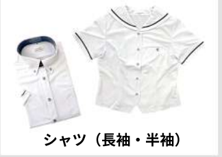
シャツ (長袖・半袖)

制服に使われるタータンチェック柄は スコットランドの伝統的なキルトメーカー 「キンロックアンダーソン社」が認めた高岡 龍谷高校だけのオリジナルのチェック柄。